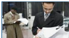
危机中局专题:美经济首季萎缩幅度小于初估