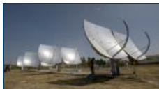
十大行业专题:中国新能源规划会在适当时机出台